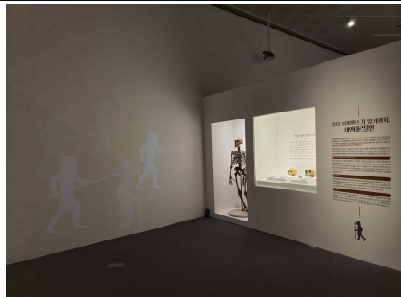
전시장 전경-네안데르탈인 전시