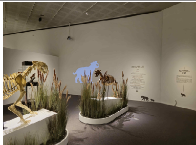
전시장 전경-검치호 전시