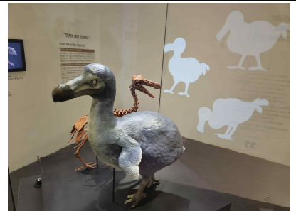
전시장 전경-도도새 전시